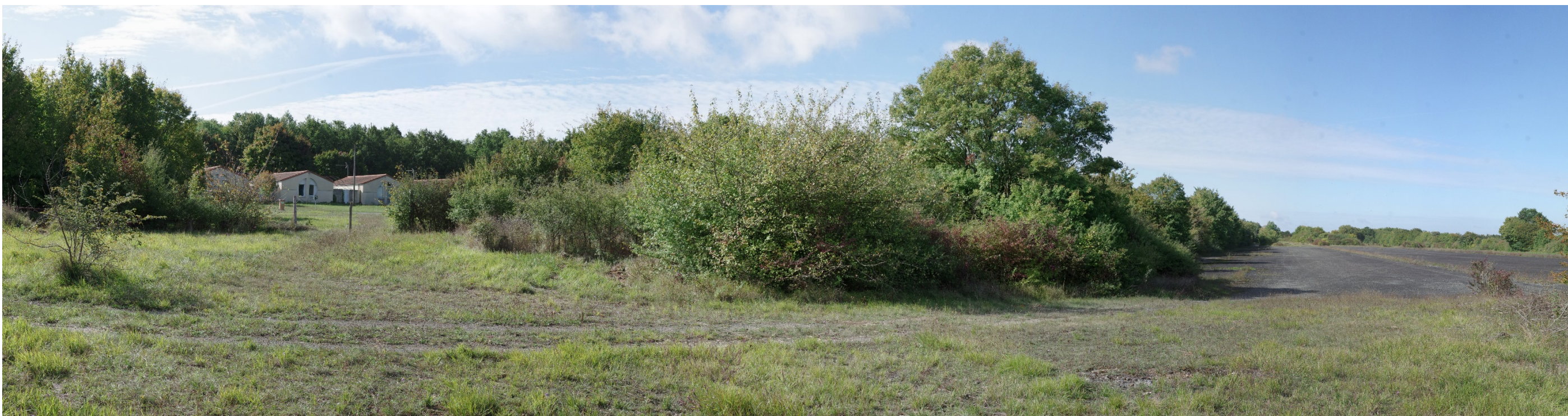
Figure 7 - Vue A - état initial