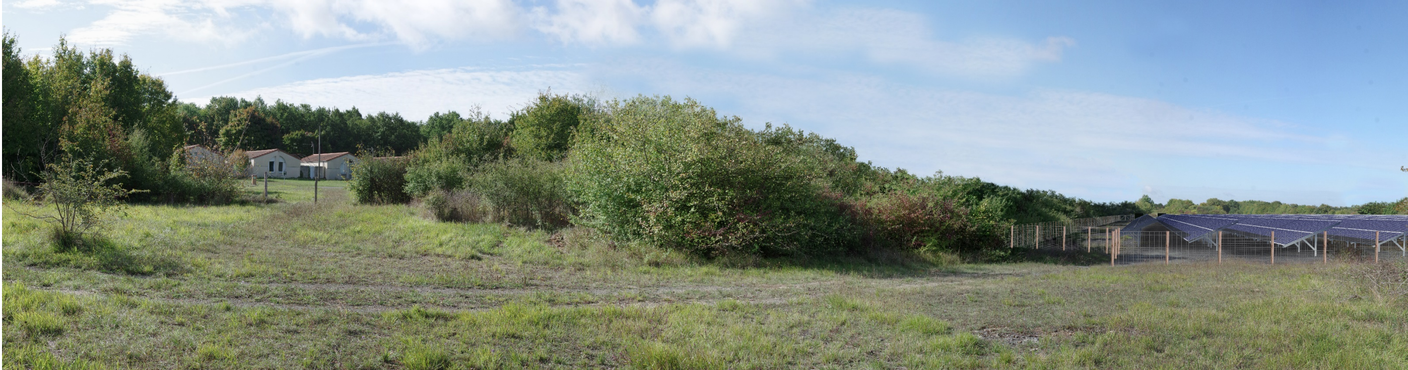
Figure 8 - Vue A - Vue projetée